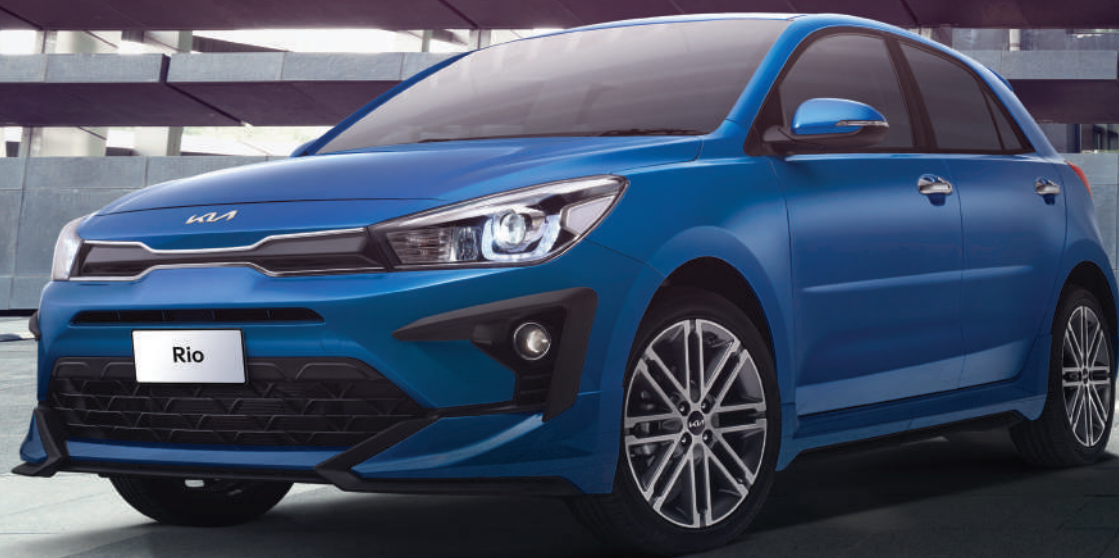
Kia Rio Hatchback