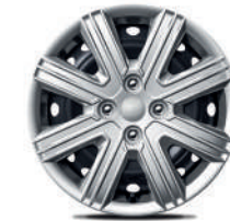
Rines de acero de 15" L Sedán