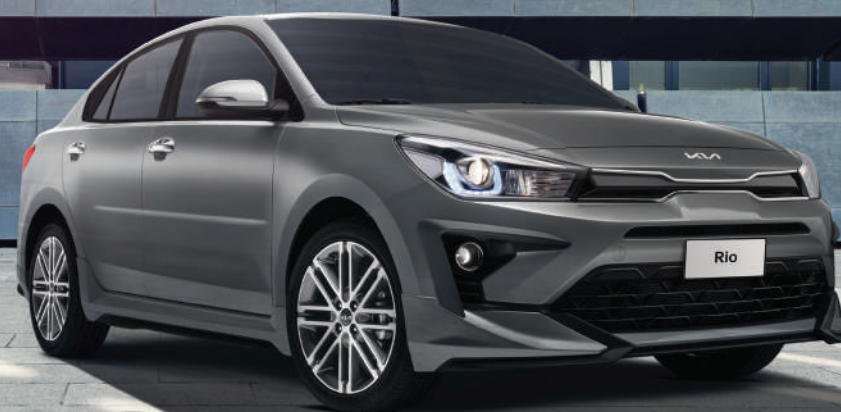
Kia Rio Sedán