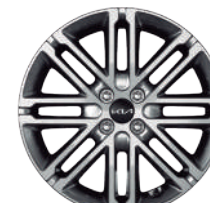
Rines de aluminio de 17" EX PACK, S PACK Hatchback EX y S PACK Sedán