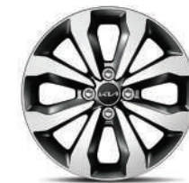
Rines de aluminio de 15" LX-EX Hatchback LX Sedán