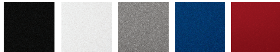
Negro Blanco Plata Azul Rojo